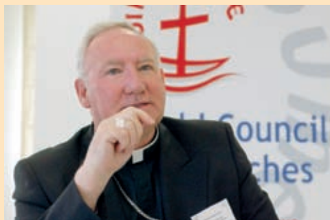
mons. Brian Farrell del Pontificio Consiglio per la promozione dell'unità dei cristiani

Come già accennato ad Edimburgo era presente anche una delegazione della Chiesa cattolica guidata da mons. Brian Farrell del Pontificio Consiglio per la promozione dell'unità dei cristiani, che ha portato ai delegati un messaggio augurale di Benedetto XVI. "Possa la Conferenza di Edimburgo rinnovare l'impegno a lavorare con umiltà e con pazienza, e sotto la guida dello Spirito Santo, a vivere di nuovo insieme la comune eredità apostolica". Le parole del Papa diventano il nostro auspicio e la nostra preghiera.