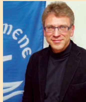
Olav Fykse Tveit, segretario generale del Consiglio ecumenico delle chiese CEC

Dall'entusiasmo e dalla consapevolezza maturata ad