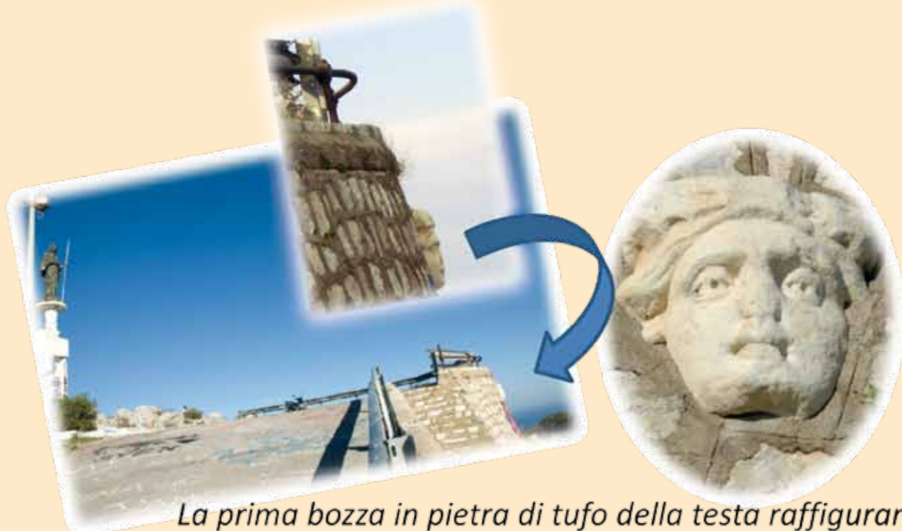
La prima bozza in pietra di tufo della testa raffigurante Santa Rosalia - si trova incastonata in questo muro