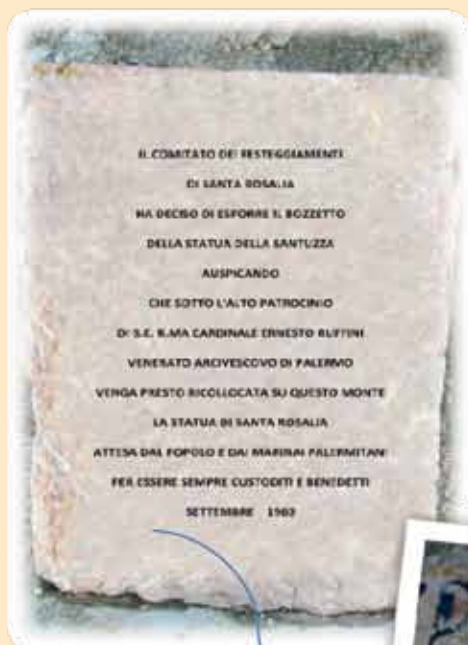
La scritta sul cippo abbandonato