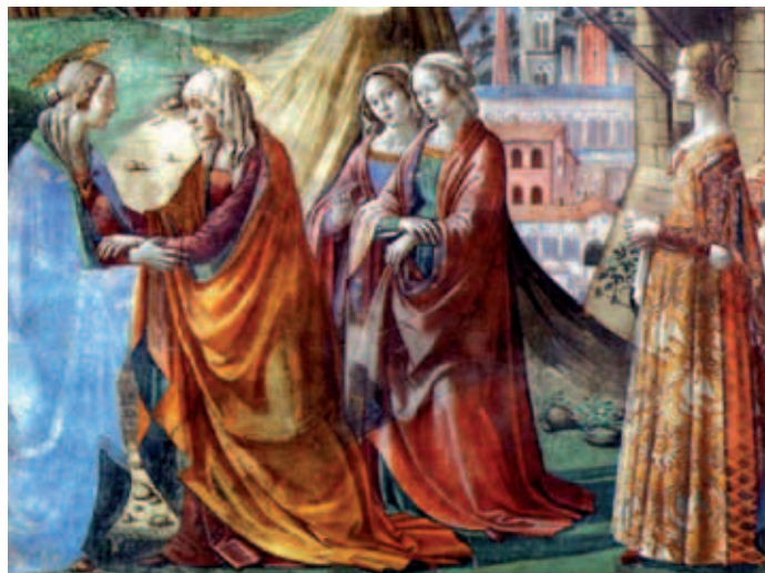
Elisabetta accoglie Maria, la Madre di Dio, nella sua casa.

coesa e resa generativa dall'apporto delle diversità e delle differenze donate, ricevute e ricambiate, e animata dallo spirito della fraternità universale, aperta a comprendere tutti "senza distinzione" di sorta.