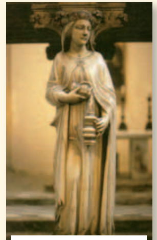
Giovanni Di Balduccio Arca di San Pietro Martire.

agire. Gli si dà (con la temperanza) un amore totale che nessuna sventura può far vacillare (e questo mette in evidenza la forza), un amore che obbedisce a lui solo (e questa è la giustizia), che vigila al fine di discernere ogni cosa, nel timore di lasciarsi sorprendere dall'astuzia e dalla Allora, a partire da questo, arriviamo a dire che la virtù della temperanza corrisponde all'essere capaci di «affinare» il nostro modo di vivere, di evitare gli eccessi e le passioni, le distorsioni e le spigolosità. Menzogna (e questa è la prudenza)».