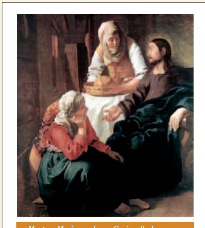
Marta e Maria accolgono Gesù nella loro casa.

Il beneficio, aggiunge, "è una cosa nella dimensione spirituale...; non consiste né nell'oro, né nell'argento né in alcuna di quelle cose cui si attribuisce un gran valore, ma nella volontà stessa di chi lo dà". Più avanti precisa: "il beneficio è sia