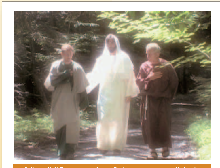
I discepoli di Emmaus accolgono Gesù, come compagno di viaggio.

Il donare produce frutti in termini di corrispondenza, di corresponsione, di risposta analoga od omologa da parte di chi ha ricevuto il dono, senza, però, da parte di chi ha donato, l'aspettativa del contraccambio (cfr. Seneca, De beneficiis, I,1,12). Il "ricevere" induce nel ricevente un senso di gratitudine e, poi, di obbligazione "non-obbligata" né "obbligante", ma "riconoscente": colui che riceve riconosce nell'altro, in colui che dona, la fonte della propria gratificazione, ma anche la fonte del riconosci-