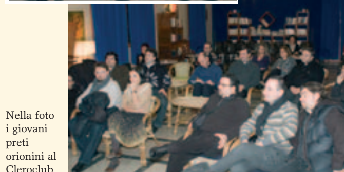
Nella foto i giovani preti orionini al Cleroclub.