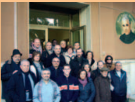
Vari momenti dei lavori del Coordinamento zonale Sicilia-Calabria.

Come pianificato durante il coordinamento provinciale svolto a Roma lo scorso mese di novembre, il 21 febbraio si è tenuto a Palermo l'incontro di zona per i Coordinatori MLO che hanno sede a Reggio Calabria, Messina, Paternò, Florida e Palermo.