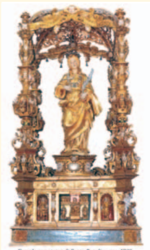
Fercolo con statua di Santa Rosalia - sec. XVII

La doratura venne eseguita nel 1604 dai maestri Baldassare Crapiti e Mariano Siragusa, attivi a Palermo tra la fine del XVI e gli inizi del XVII secolo. La "Vara" di S. Rosalia è un vero capolavoro di scultura lignea siciliana del '600 e un fine esempio della cultura tardomanierista (e non barocca come molti credono). Ancora oggi, dopo più di 400 anni, la "vara", seppure guastata da numerosi restauri e ridipinture (1879, 1982, 1986), mantiene le sue originali funzioni e viene portata in processione, rigorosamente a spalla da venti portatori, il 4 settembre, giorno della festa della Patrona di Bivona.