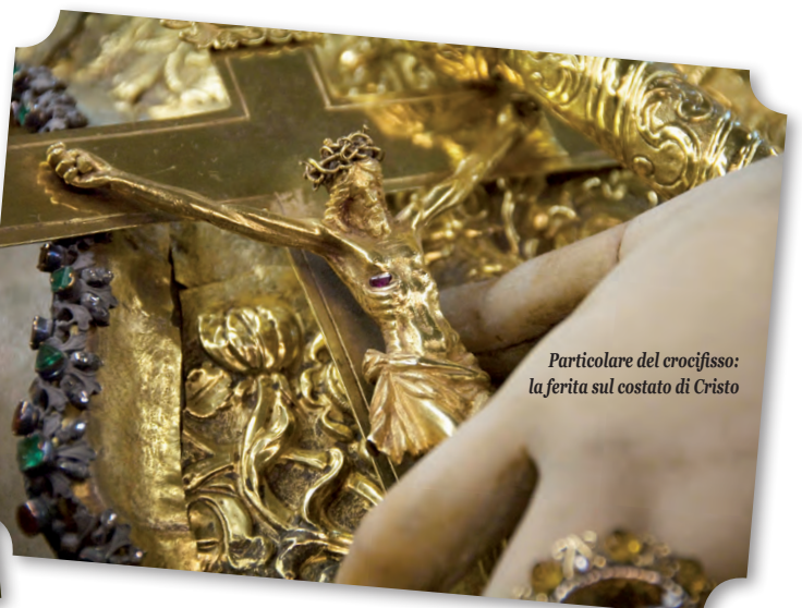
Particolare del crocifisso: la ferita sul costato di Cristo