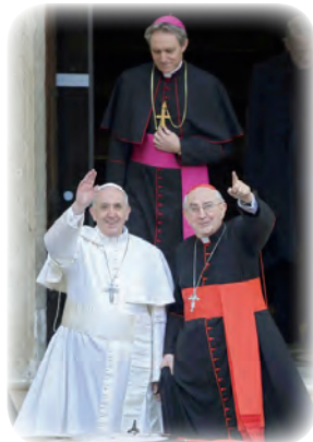
Il primo saluto ai giovani studenti del Liceo Ginnasio “Pilo Albertini”

Lo scudo blu è sormontato dai simboli della dignità pontificia, uguali a quelli voluti dal predecessore Benedetto XVI (mitra collocata tra chiavi decussate d'oro e d'argento, rilegate da un cordone rosso). In alto, campeggia l'emblema dell'ordine di provenienza del Papa, la Compagnia di Gesù: un sole raggiante e fiammeggiante caricato dalle lettere, in rosso, IHS, monogramma di Cristo. La lettera H è sormontata da una croce; in punta, i tre chiodi in nero. In basso, si trovano la stella e il fiore di nardo. La stella, secondo l'antica tradizione araldica, simboleggia la Vergine Maria, madre di Cristo e della Chiesa; mentre il fiore di nardo indica San Giuseppe, patrono della Chiesa universale. Nella tradizione iconografica ispanica, infatti, San Giuseppe è raffigurato con un ramo di nardo in mano. Ponendo nel suo scudo tali immagini, il Papa ha inteso esprimere la propria particolare devozione verso la Vergine Santissima e San Giuseppe.