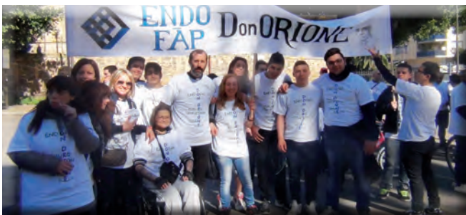
La nostra forza: dipendenti insieme con i nostri allievi, ex allievi e le loro famiglie.