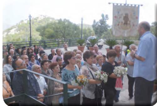
Pellegrinaggio di fedeli giunti da Lentiscosa (Salerno)