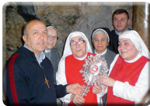
Le suore orionine "Sacramentine non vedenti" di Tortona.