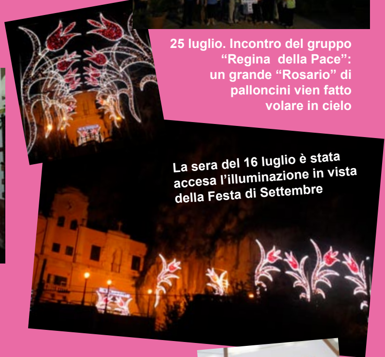
La sera del 16 luglio è stata accesa l'illuminazione in vista della Festa di Settembre