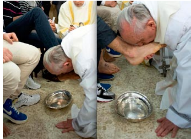
Papa Francesco con i carcerati di Castrovillari

"Ciò di cui abbiamo bisogno, specialmente in questi tempi, sono testimoni credibili che con la vita e anche con la parola rendano visibile il Vangelo, risvegliano l'attrazione per Gesù Cristo, per la bellezza di Dio"