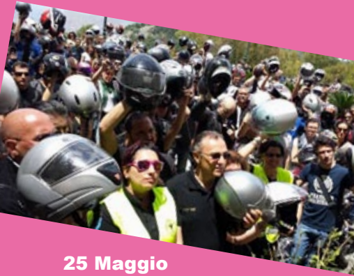
25 Maggio Motoacchianata 2014 Affidamento dei motociclisti a S. Rosalia e Benedizione dei caschi al Santuario.