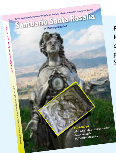
Foto di copertina: Reliquia del dente di santa Rosalia con Palermo sullo sfondo e particolare del basamento della Statuetta-reliquiario

Insieme ai confratelli vi auguriamo di vivere una vita piena e vi assicuriamo il nostro ricordo nella preghiera. S. Rosalia e don Orione intercedano per voi e la Madonna vi accompagni.