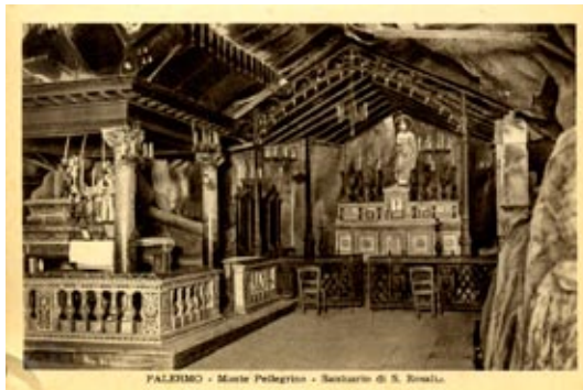
PALERMO - Monte Pellegrino - Basilica di S. Rosalia.

Buckland, cristiano protestante, era geologo ma conosceva