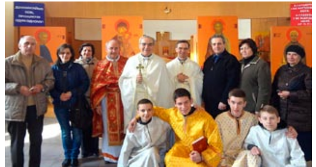
Orionini a Leopoli (L'VIV) Ucraina.

“Ci vuole un illuminato spirito di intrapresa, se nò certe opere non si fanno: la vostra diventa una stasi, non è più vita di apostolato ma è lenta morte e fossilizzazione. Avanti, dunque! Non si potrà fare tutto in un giorno, ma non bisogna morire né in casa, né in sacrestia: fuori di sacrestia! Non perdere d'occhio mai la Chiesa, né la sacrestia, anzi il cuore deve essere là, la vita là, là dove è l'Ostia; ma, con le debite cautele, bisogna che vi buttiate ad un lavoro che non sia più solo il lavoro che fate in Chiesa”. (Lettera del 12.1 1930 ai “cari figli brasiliani” di S. Paolo in Brasile).