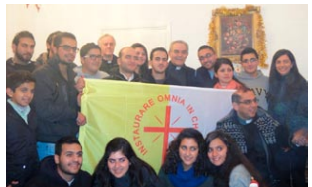
“Saint Joseph School”, Scuola Orionina con studenti mussulmani e cristiani a Zarqa (Giordania)