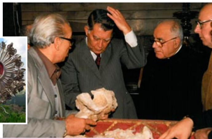
Ricognizione del 1987 alla presenza del card. Salvatore Pappalardo

Buckland nel 1826? Vide dei resti che, trattiene presso il Santuario, non potevano essere della Santa.