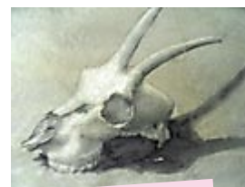
Teschio di capra

Lì sono rimaste chiuse fino al 1834. E allora, cosa vide il