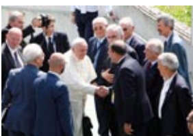
Papa Francesco e il Pastore evangelico Giovanni Traettino - Caserta, 26 luglio 2014: Storica visita alla Chiesa Evangelica della Riconciliazione

"Vi ringrazio dal profondo del cuore per aver accettato il mio invito a venire qui per invocare insieme da Dio il dono della pace. Spero che questo incontro sia l'inizio di un cammino nuovo alla ricerca di ciò che unisce, per superare ciò che divide ... la vostra presenza signori presidenti è un grande segno di fraternità, che compite quali figli di Abramo, ed espressione concreta di fiducia in Dio, Signore della storia, che oggi ci guarda come fratelli l'uno dell'altro e desidera condurci sulle sue vie. Per fare la pace ci vuole coraggio, molto di più che per fare la guerra. Ci vuole coraggio per dire sì all'incontro e no allo scontro; sì al dialogo e no alla violenza; sì al negoziato e no alle ostilità; sì al rispetto dei patti e no alle provocazioni; sì alla sincerità e no alla doppiezza. Per tutto questo ci vuole coraggio, grande forza d'animo"