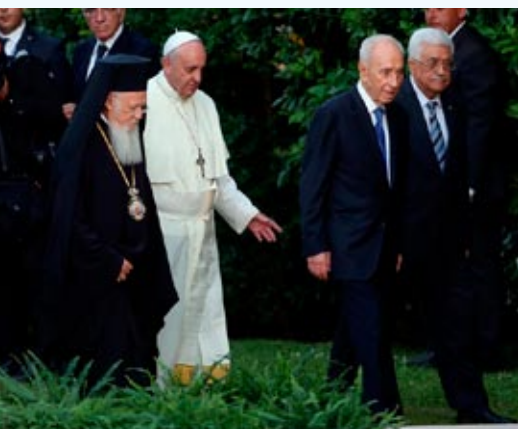
Città del Vaticano , 8 giugno 2014: Papa Francesco, il Patriarca ecumenico ortodosso di Costantinopoli Bartolomeo, il Presidente israeliano Shimon Peres e il presidente di Palestina Mahmoud Abbas (Abu Mazen) pregano per la pace.

"Vi ringrazio dal profondo del cuore per aver accettato il mio invito a venire qui per invocare insieme da Dio il dono della pace. Spero che questo incontro sia l'inizio di un cammino nuovo alla ricerca di ciò che unisce, per superare ciò che divide ... la vostra presenza signori presidenti è un grande segno di fraternità, che compite quali figli di Abramo, ed espressione concreta di fiducia in Dio, Signore della storia, che oggi ci guarda come fratelli l'uno dell'altro e desidera condurci sulle sue vie. Per fare la pace ci vuole coraggio, molto di più che per fare la guerra. Ci vuole coraggio per dire sì all'incontro e no allo scontro; sì al dialogo e no alla violenza; sì al negoziato e no alle ostilità; sì al rispetto dei patti e no alle provocazioni; sì alla sincerità e no alla doppiezza. Per tutto questo ci vuole coraggio, grande forza d'animo"