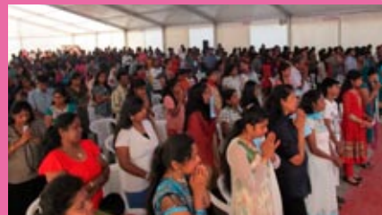
Celebrazione in lingua Tamil nella grande tenda bianca