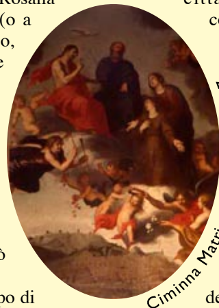
Ciminna Matrice - G. Gerardi 1627

La festa viene celebrata il 4 settembre.