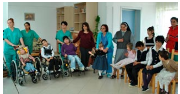
Ospiti nel nostro centro di Volontari (Romania).