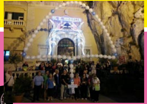
25 luglio. Incontro del gruppo "Regina della Pace": un grande "Rosario" di palloncini vien fatto volare in cielo