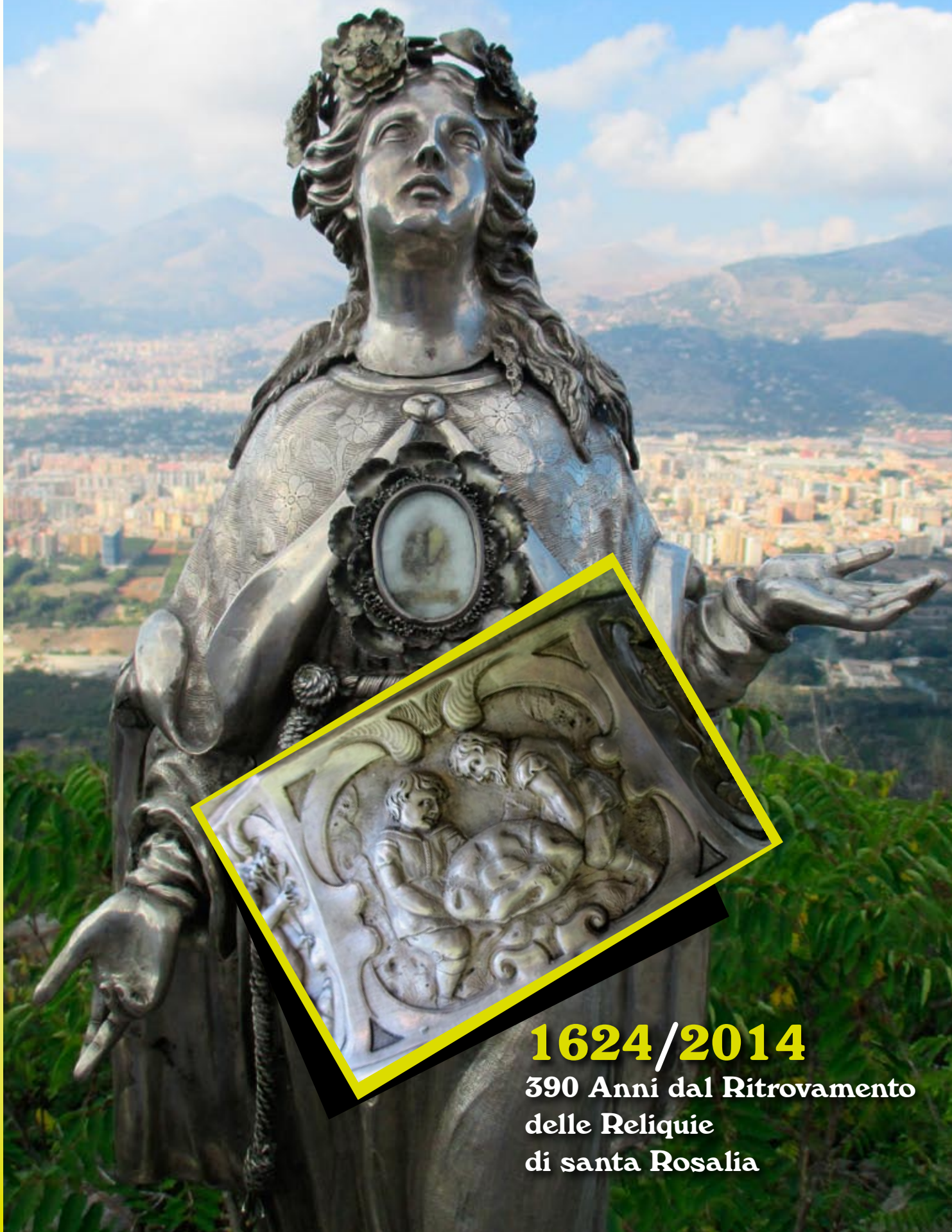
Abb. Postale D.L. 353/2003 (conv. in L. 27/02/04 n° 46) art. 1 comm. 2/c DCB Palermo - Reg. Trib. PA 33*11/11/2004

Periodico dell'Opera Don Orione in Palermo • Anno IX n° 2/2014