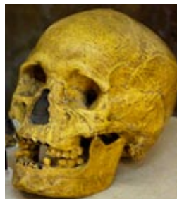
Teschio di donna