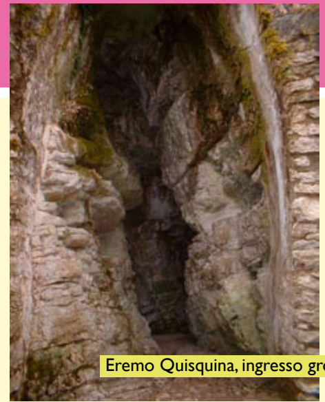
Eremo Quisquina, ingresso grotta

Inoltre, sull'altare maggiore, c'è un magnifico "Fercolo ligneo dorato con statua di S. Rosalia" che viene portato in processione il 4 di settembre durante la festa organizzata da