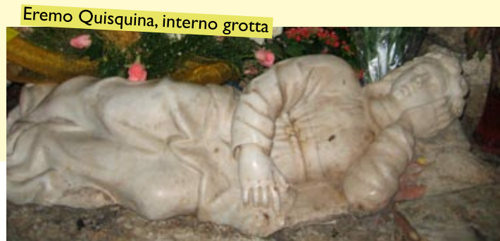
Eremo Quisquina, interno grotta