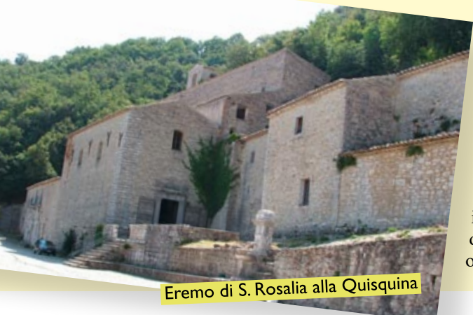
Eremo di S. Rosalia alla Quisquina