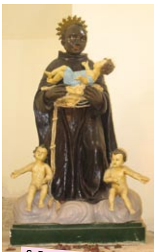
S. Benedetto il Moro

Si narra che un frate francescano, Benedetto il Moro, già molto caro al popolo palermitano (Benedetto Manassari, 1524 ca./1589), dedicasse molto della sua permanenza sul monte alla ricerca (1555/1562), fermato in tempo solo da un' apparizione della Santa che gli disse che le ossa sarebbero state ritrovate in seguito, durante un terribile flagello, per salvare il popolo di Palermo.