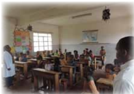
MADAGASCAR La scuola Don Orione