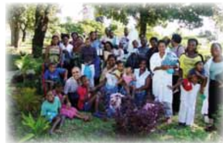
MOZAMBICO Famiglie e allievi presso la scuola Don Orione