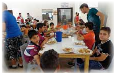
GIORDANIA Giovani iracheni e siriani ospitati presso il Centro Don Orione a Zarqa