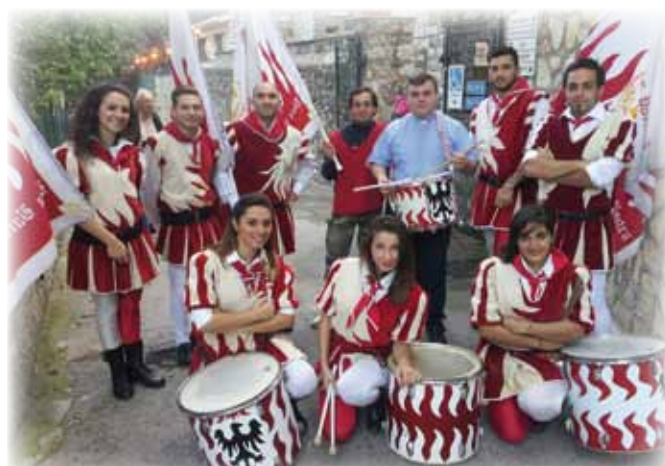
SBANDIERATORI "ANTICA IBLA MAYOR" DI PATERNÒ